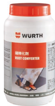
Art. no. 0893110

鐵鏽轉換劑可滲透進入鐵鏽中，與鐵鏽產生反應並將氧化鐵轉換成穩定、不溶的藍黑色金屬有機複合物。