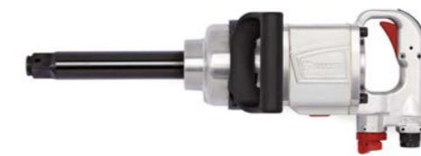
Art. no. 07037700