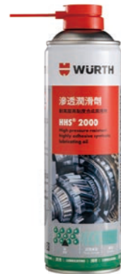
Art. no. 0893106